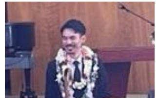
Paster Shinasue Ordination