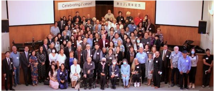
75 th Anniversary Celebration

ミッション・ステートメント：私たちはイエスキリストに従う教会の家族です。神がいかなるお方であるかを理解する事に努め、全ての人たちが聖霊の神の導きに従うように励まし、日系コミュニティに社会奉仕をするように特別に委ねられていることを認め、励みます。